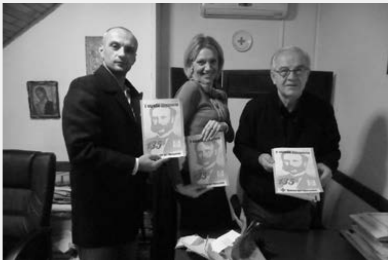
Део редакције у тренутку пристизања првог двоброја часописа.

Урадило се доста, но пошто часопис има мало страна, све се не може наћи између његових корица, ал' и то што је унето може се сматрати довољним, за инспирацију другима - да буду у хуманом раду са нама, да буду у духу имена часописа - У СЛУЖБИ ХУМАНОСТИ!