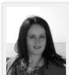
Приредила Биљана Цветковић

Програм „Промоција хуманих вредности“ промовише уважавање културолошких и етничких разлика кроз развој позитивног васпитног окружења заснованог на интеркултуролошким вредностима у основним школама на територији Републике Србије.