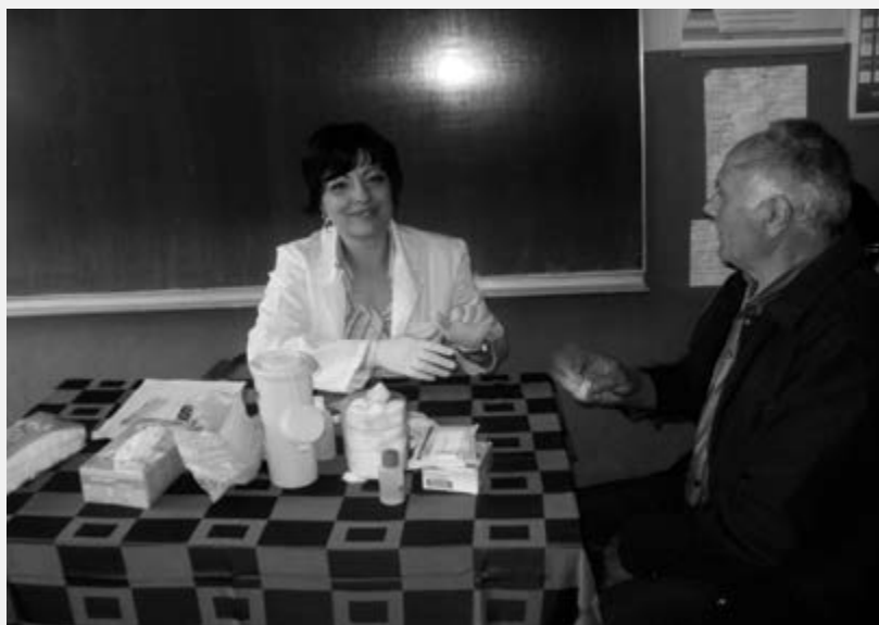
Контрола гликемије мештанима села

Црвени крст Крагујевца је у оквиру свих ових акција, поред пакета хране и средстава за хигијену, за најугроженије мештане, обезбедио и средства за хигијену за 3 школе и предшколце: четкице за зубе, пасте за зубе, сапун и едукативни и пропагандни материјал посвећен