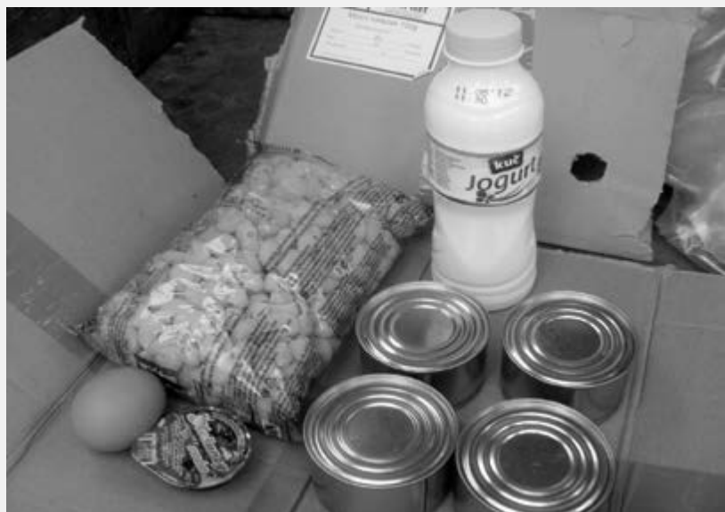
Донација за кориснике народне кухиње, Коло српских сестара, Интеркомерц - Рача, Некретнине "Брковић"

У складу са својом мисијом, Црвени крст Крагујевца се одувек, а последњих година интензивније, захваљујући подршци донатора, бави пројектима који за циљ имају заштиту животне средине. Тако су искуства из прошлог пројекта „Доћи, научи, про-