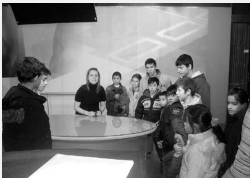
Учесници програма "Зимујмо код куће" у посети Радио Телевизији Крагујевац