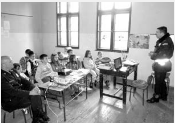
Предавање о понашању у саобраћају