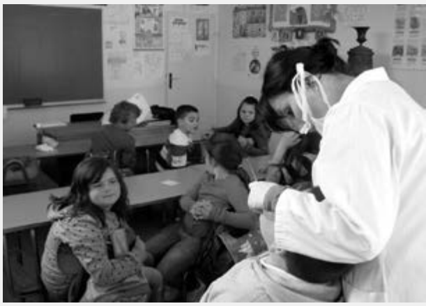
Стоматолошки прегледи деце