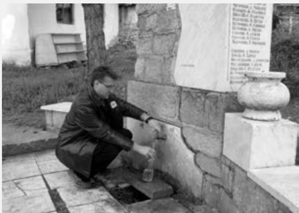
Контрола исправности воде за пиће