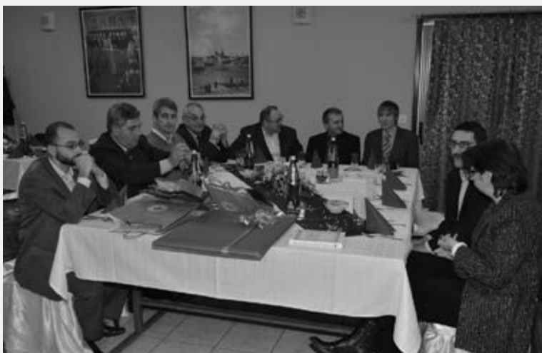
Гости из иностранства

Хуманитарна идеја као саставни део нових цивилизацијских тековина деветнаестог века одмах се примила у Србији, и наравно Крагујевцу као последица потребе нашег народа да изрази своју дубоко хума-