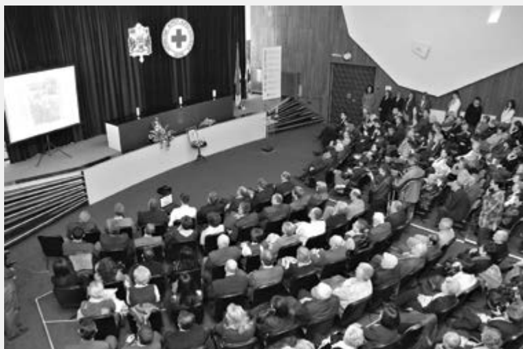
16. децембар 2011. год. Свечаност поводом обележавања 135 година Црвеног крста Крагујевца

Јако је важно поменути да од 1994. године Црвени крст и кроз програм Народне кухиње пружа помоћ најугроженијима. Те године помоћ у оброцима добијало је 700 лица а 2000. године – 4300 лица. Те исте 2000. године, 6.000 деце основношколског узраста примало је бесплатну ужину, а средства за рад оба програма обезбеђивали су, и данас то чине, Црвени крст Крагујевца и Град Крагујевца, за 600 корисника Народне кухиње и 3000 деце у основним школама. Поводом 130 година -2006. године, објављена је монографија у којој је шест историчара и хроничара забележило вишедеценијски предани и пожртвовани рад.