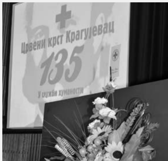
На свечаности је приказан документарни филм о историји Црвеног крста Крагујевца