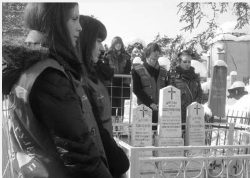
Чланови ОТЈ „Др Елизабет Рос“, одају пошту чланицама Британске мисије

Средином фебруара ове године, тачније, 14. фебруара, још једном су на Дан љубави, волонтери, сарадници и запослени у Црвеном крсту Крагујевца, посетили место вечног починка Др Елизабет Рос и њених колегиница, на Варошком гробљу. То је заправо 97. година од њихове смрти и 97. пут како им Крагујевац и његови људи одају почаст за учињена дела и указану помоћ у лечењу тифусом заражених Крагујевчана с почетка 20. века (1915.г.).