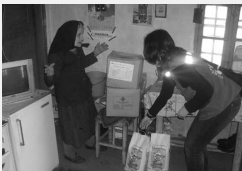
Млади волонтер Црвеног крста у акцији

Верујемо да ће волонтери, читајући текст и бројке о збринутим људима, бити задовољни и још једном препознати захвалност коју има Црвени крст одаје и даље дугује.