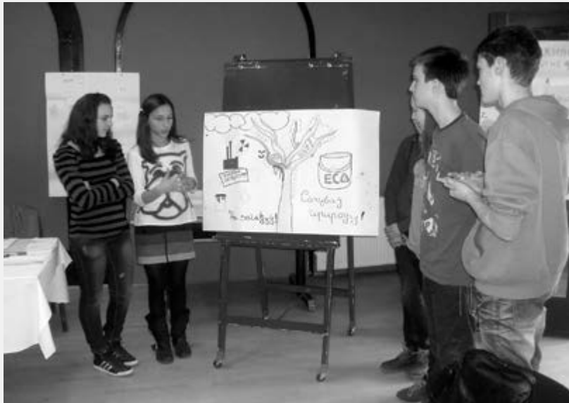
Едукација вршњачких едукатора из екологије

мени и примени“ умногоме доприне-ла да Црвени крст препозна нове проблеме у овој области и осмисли нове активности, уобличене у пројекат „Још један корак за мој чистији град“, а Град Крагујевац, тачније Градска управа за заштиту животне средине и одрживи развој – финансијски подржи његову реализацију.