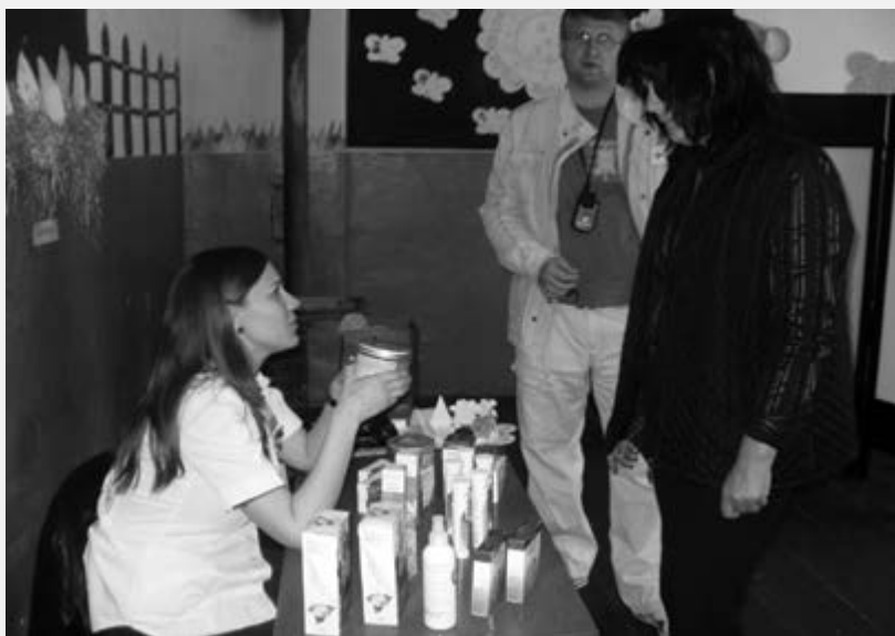
Представница Апотекарске установе у акцији “Селу у походе”

Црвени крст Крагујевца од 1982. године веома успешно реализује, у сарадњи са осталим институцијама у граду, акције “Селу у походе”. Акције се организују у селима удаљеним од здравствених центара, лоших комуникација и других фактора, где је потребна здравствена заштита посебно осетљивих категорија становништва (старије особе и деца).