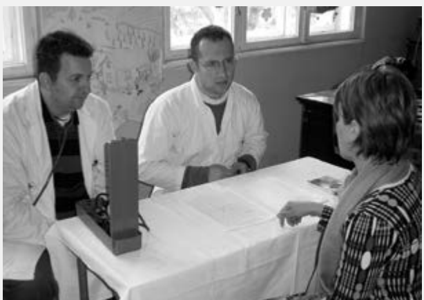
Прегледи лекара опште праксе