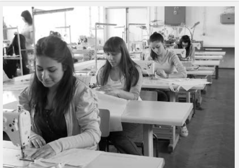
Ученице ТУШ „Тоza Драговић“ сашиле су 106 платнених торбица у оквиру пројекта „Још један корак за мој чистији град“

Поменути радионице о толеранцији и недискриминацији су изазвале код деце изузетну активност и интересовање, с обзиром на