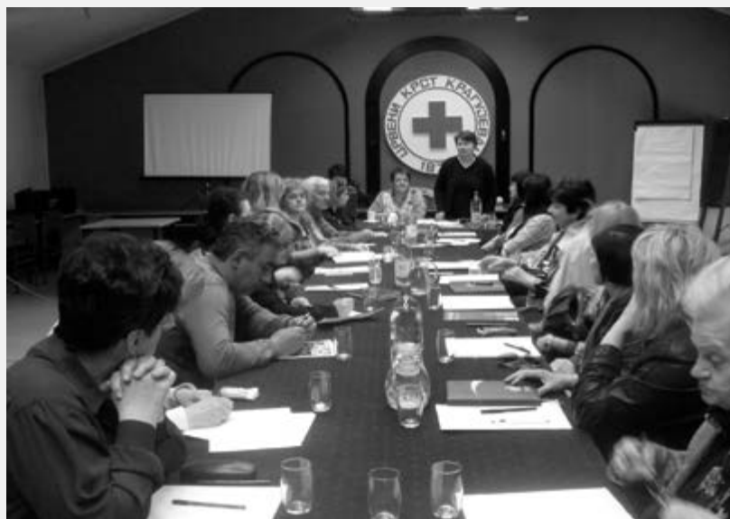
Састанак тима у оквиру пројекта "Заједнички развој заједнице"

Нажалост, нисам имао много времена да боље упознам Крагујевац, али оно што сам успео да приметим о људима у Крагујевцу, као и у Пироту и Инђији јесте да су то људи са пуно потенцијала, али им у неком тренутку недостаје покретач. Чињеница је да постоје многи проблеми у систему и са финансијама, али мој савет им је да треба да се окрену солидарности и будући да су врло срдчан и топао народ, вероватно да могу много више међусобно једни другима да помогну него што то може систем. Један добар начин је дељење информација и разговор. На пример, када сам ја своје пријатеље у Холандији упознао са ситуацијом старијих људи у Србији тј. када сам им показао слике и рекао колика су примања они су најпре схватили колика је разлика између живота старих у Холандији и живота старих у Србији. Схватили су да има људи који су у много горој ситуацији од њих и да њихов мали допринос некоме може значити много. На тај начин смо сакупили новац за транспортно возило које је потребно организацији у Пироту.