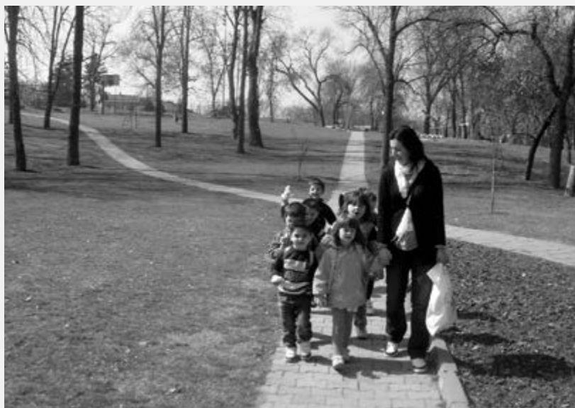
Боравак деце из забавишта "Дуга у Еко парку у Илићеву

Боравак у забавишту је несумњиво изузетно значајан за ову групацију деце, посебно у васпитном делу – за децу из колективног смештаја, која показују слободније понашање и опхођење