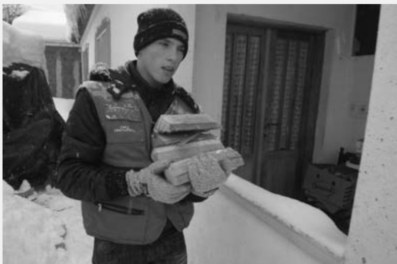
Млади волонтер Црвеног крста у акцији

У складу са својом мисијом и задацима, Црвени крст Крагујевца је, услед али и пре проглашења ванредне ситуације изазване великим снежним падавинама, благовремено почео да делује и пружа помоћ становништву, које је било посебно угрожено у оваквој ситуацији. Наше су жеље, пажња и настојања били усмерени на опасности које су биле могуће, било нам је битно да нам нико од суграђана на селу, приграду и граду не пати, не буде гладан или се не смрзне, јер су високи снежни наноси претили непроходношћу путева и прилаза, недостатком хране, огрева, лекова старијим и усамљеним лицима и затрпавањима трошних домаћинстава.