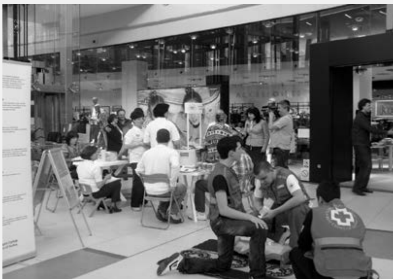
Обележавање 7. априла - Светског дана здравља у "Крагујевац Плаза" центру

Светски дан здравља – 7. април ове године на тему: „Старење и здравље: здравље додаје живот годинама“ Црвени крста Крагујевца је обележио бројним активностима, у складу са препорукама Црвеног крста Србије, а у сарадњи са: Институтом за јавно здравље, Домом здравља Крагујевац и Превентивним центром.