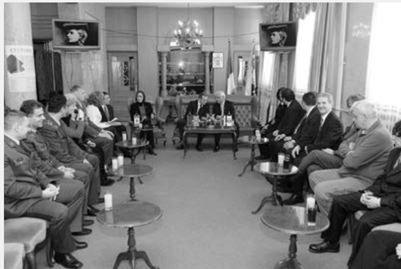
Пријем за амбасадоре и госте у свечаном салону Града

Дозволите ми најпре да се захвалим Граду Крагујевцу и Црвеном крсту