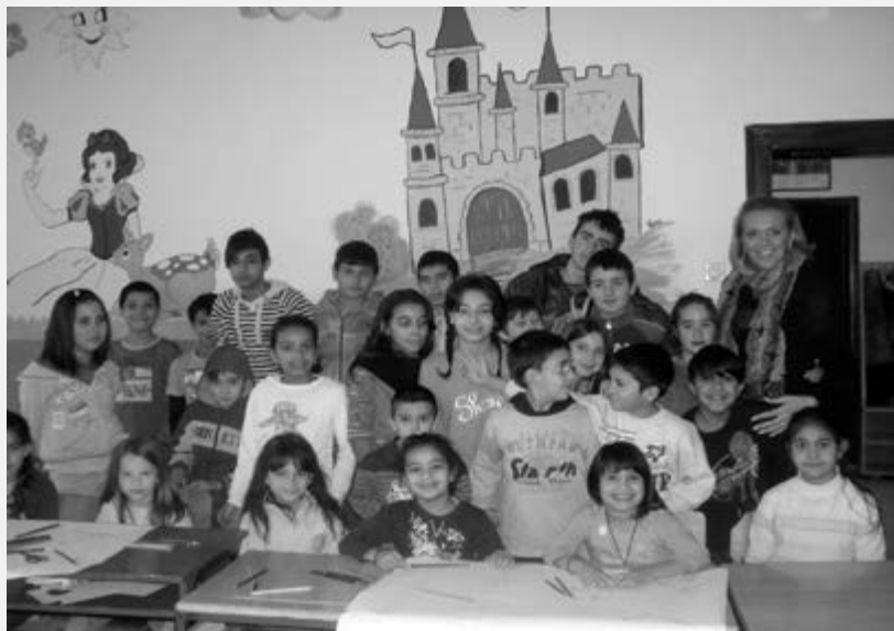
Учесници програма "Зимујмо код куће"

чињеницу да су, због саме средине у којој живе (присуство различитих верских, расних и др. опредељења), али и због узраста у којем су, свађе и туче међу овом децом веома честе.