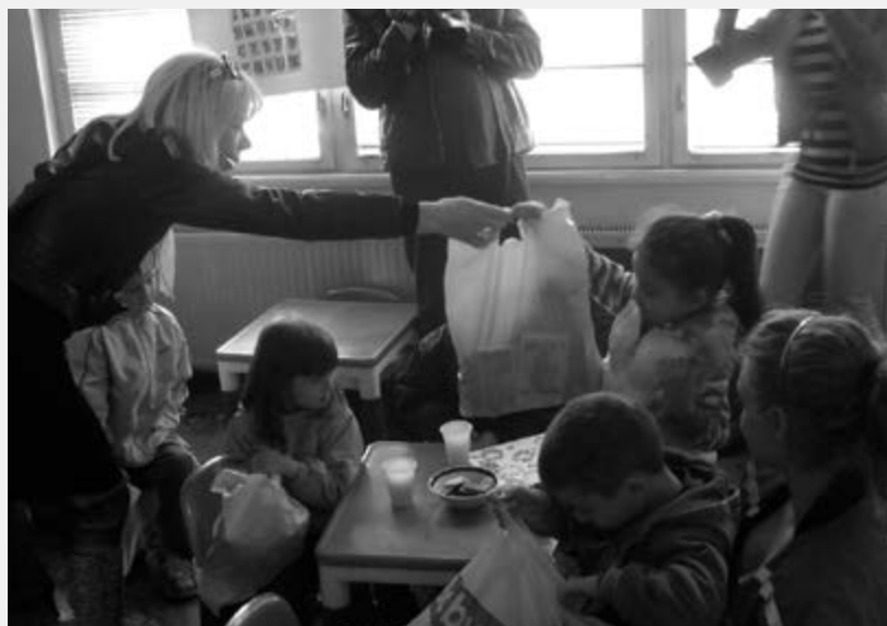
Посета представнице Кола српских сестара забавишту "Дуга"

- примили смо донацију слаткиша за кориснике народне кухиње